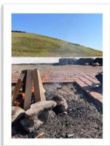
季節の イベントも