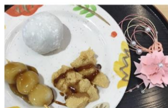
創作活動で 季節の小物作り