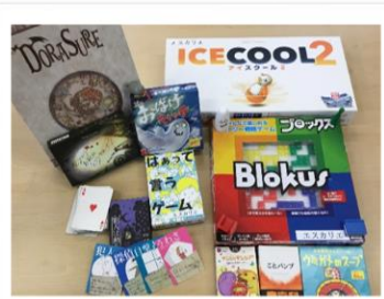
アナログゲームで カード・ボードゲーム